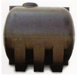
Tabela de Dimensões